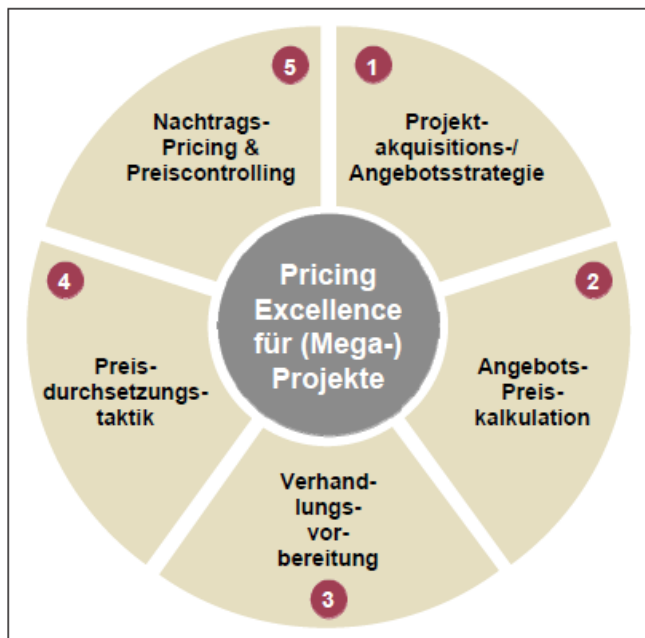
Abbildung 1: Pricing Excellence-Ansatz für (Mega-)Projekte

Diese Grafik ist übersichtlich, gut strukturiert und in einem Farbschema gehalten. So ähnlich könnten auch die Grafiken zu Ihrem Beitrag aussehen.