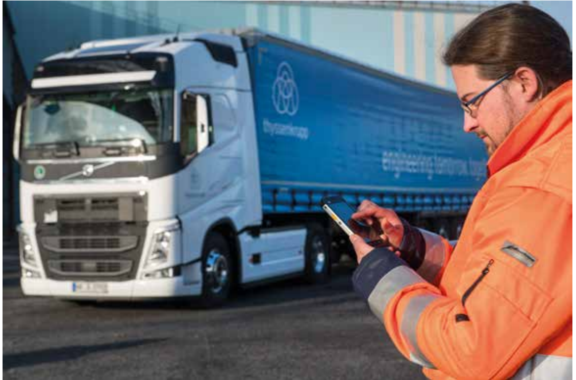
Abbildung 1: Ziel des ersten Projekts auf Basis des Industrial Data Space ist die Optimierung des Be- und Entladeverkehrs des thyssenkrupp Standorts Duisburg.

Softwarefirmen zu, die nun auch die Möglichkeit haben, im Ökosystem Industrial Data Space selbst Software zu vermarkten.